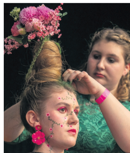
Beim Lehrlingsfrisieren wurde Kreativität grossgeschrieben.

125 Lernende aus der ganzen Zentralschweiz stellten am Sonntag, 21. Januar, in der Festhalle Seepark in Sempach ihr handwerkliches Geschick und ihre Kreativität vor rund 750 Zuschauern unter Beweis. Das Organisationskomitee der 'HaarKunst 2024' freute sich, dass es nach vier Jahren Unterbruch wieder ein erfolgreiches Lehrlingsfrisieren durchführen durfte, meint die Zentralschweizer Sektion des Verbands Schweizer Coiffeurgeschäfte in einer Mitteilung. Beim Wettbewerb wurden die Lernenden nicht nur gefordert, sondern auch gefördert und hatten die Möglichkeit, wichtige Kontakte zu pflegen und Tipps abzuholen. Die Veranstaltung sei zudem eine